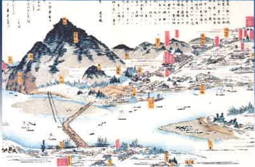
岐阜市街鳥瞰図(部分)

休館日/毎週月曜日(8月13日[月]は開館) 開館時間/午前9時～午後5時 (最終入館は午後4時30分まで) ※7月27日(金)は午前10時から開場