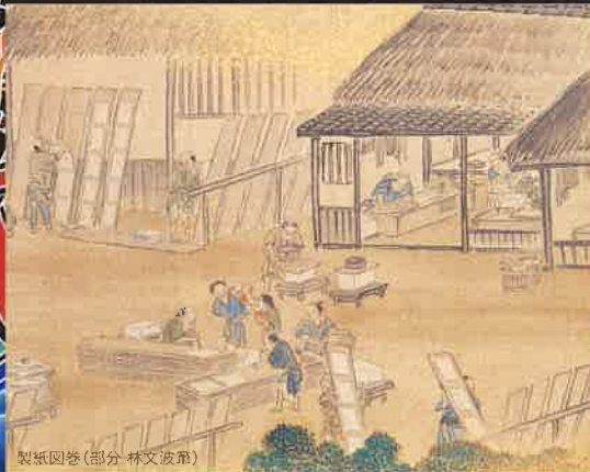
製紙図巻(部分 林文波筆)