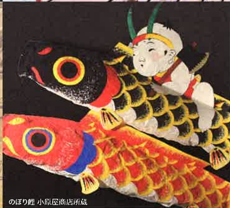
のぼり鯉 小原屋商店所蔵