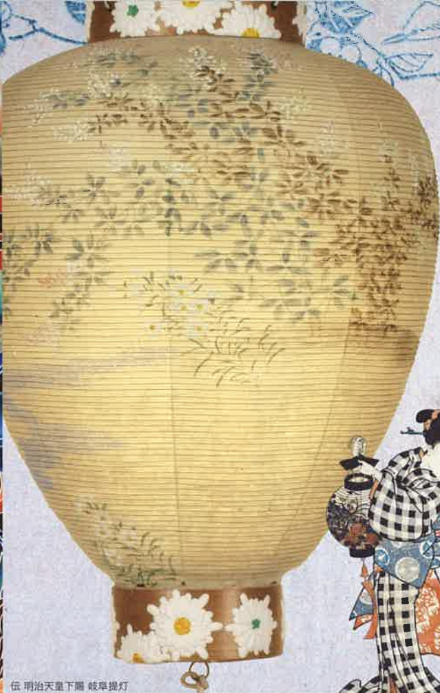
佐 明治天皇下賜 岐阜提灯