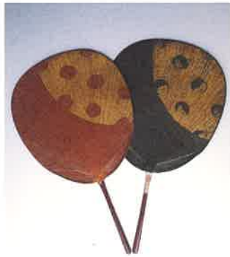
第6回東海輸出工芸展出品 岐阜扇房 住井富次郎商店所蔵