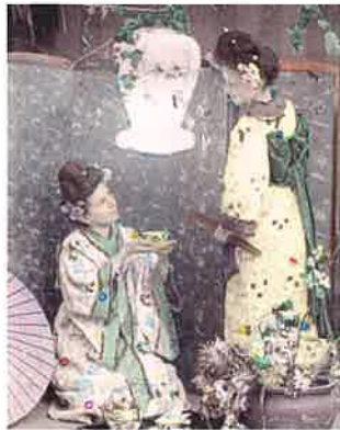
ポストカード ジャパネズリー(部分)

美濃地方は古くから良質な竹や和紙の産地に恵まれ、長良川中流域に位置する岐阜は水運を利用した物資の集散地となっていました。このような地理的条件のもと、岐阜では良質な竹や和紙を材料とした傘・提灯・扇等の生産が発達し、名産品として名を馳せたほか、清らかな水を利用した染物も盛んに行われてきました。これらは日常の用具であるだけでなく、その繊細優美なデザインで多くの人目を惹き、特に明治以降は海外でも高い評価を得ました。さらに近年ではこれらの伝統的なモノ作りは文化としても評価され、国の伝統的工芸品や登録有形民俗文化財、県の郷土工芸品などの指定を受け、職人の製作技術についても注目が高まっています。本展ではこれらの歴史や卓越した機能、デザイン、職人の手仕事の道具などを紹介し、その魅力に迫ります。