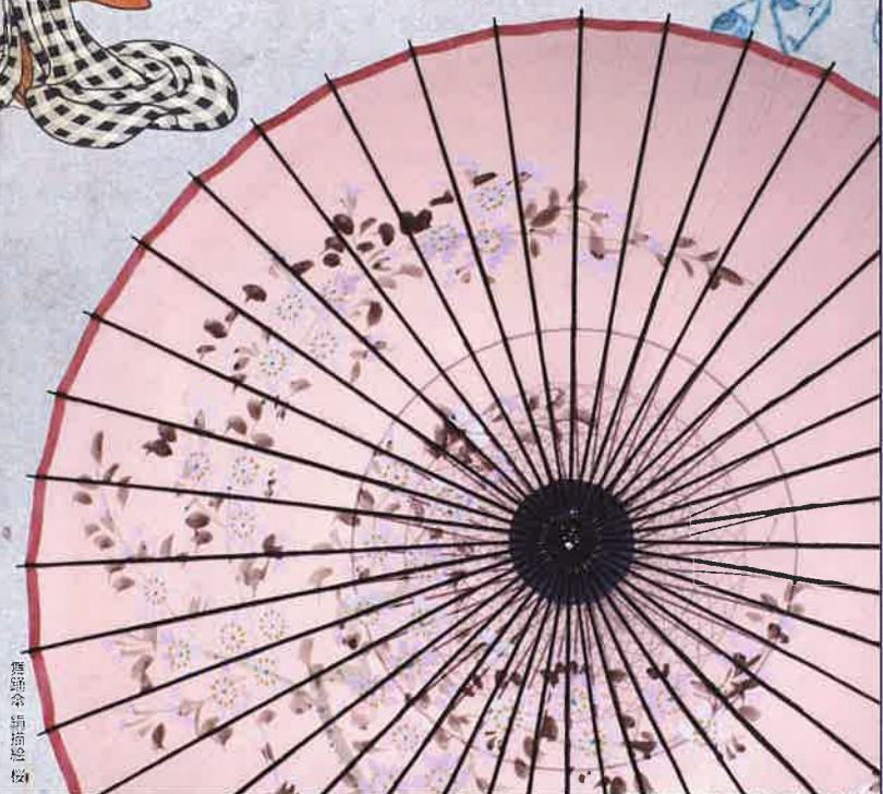
舞踊家 絹掛 悠樹