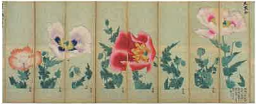
提灯絵紙添込見本 大芥子

美濃地方は古くから良質な竹や和紙の産地に恵まれ、長良川中流域に位置する岐阜は水運を利用した物資の集散地となっていました。このような地理的条件のもと、岐阜では良質な竹や和紙を材料とした傘・提灯・扇等の生産が発達し、名産品として名を馳せたほか、清らかな水を利用した染物も盛んに行われてきました。これらは日常の用具であるだけでなく、その繊細優美なデザインで多くの人目を惹き、特に明治以降は海外でも高い評価を得ました。さらに近年ではこれらの伝統的なモノ作りは文化としても評価され、国の伝統的工芸品や登録有形民俗文化財、県の郷土工芸品などの指定を受け、職人の製作技術についても注目が高まっています。本展ではこれらの歴史や卓越した機能、デザイン、職人の手仕事の道具などを紹介し、その魅力に迫ります。