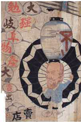
岐阜物産店宣伝啓